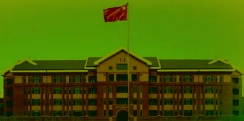
天津机电职业技术学院

TIANJIN VOCATIONAL COLLEGE OF MECHANICAL AND ELECTRICAL ENGINEERING